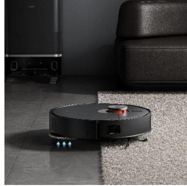
זיהוי שטיחים והרמה אוטומטית של המטליות