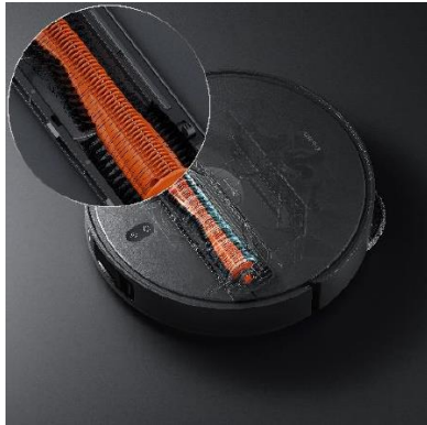
מברשת עם סכינים המונעת הסתבכות שיער ופרווה