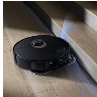
זרוע מתארכת חדשנית לניקוי צמוד לקירות