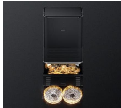
שטיפת מטליות במים חמים וייבוש מטליות באוויר חם