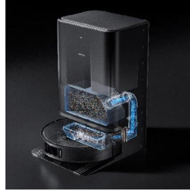
תחנת עגינה הכל באחד